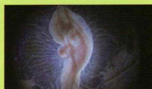
からだの中の宇宙 -超高精細映像が解き明かす-