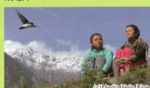
A Seed of Hope