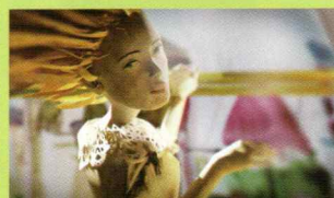
The Blissful Accidental Death