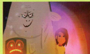
The Mountain of SGAana