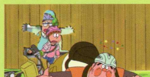
ズッコケ三人組の自転車教室 安全な乗り方を身につけようの巻