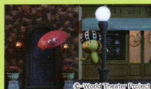
映画の妖精 フィルとムー